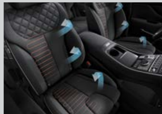
Làm mát và sưởi hàng ghế trước (Bản Đặc biệt và Cao cấp)