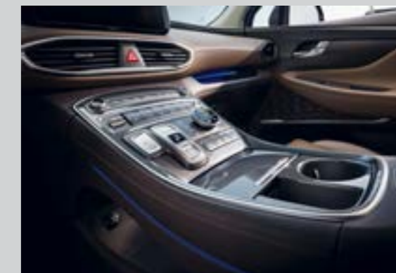
Cần số điện tử dạng nút bấm cùng đèn viền ambient light