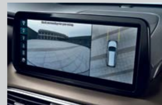
Hệ thống camera 360° (Bản Cao cấp)