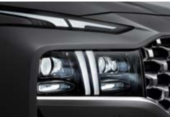
Đèn định vị ban ngày (DRL) tạo hình chữ T kéo từ nắp capo xuống hết cụm đèn chiếu sáng