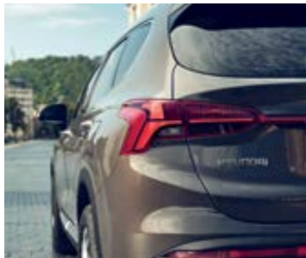
Đèn hậu công nghệ LED 3D