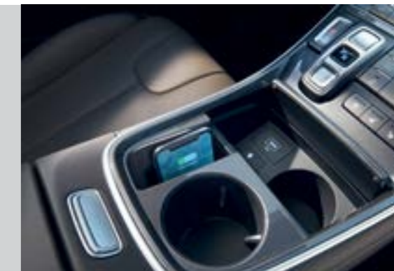
Sạc không dây chuẩn Qi