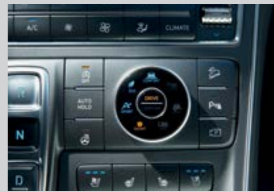
4 chế độ lái (Eco, Comfort, Sport, Smart)