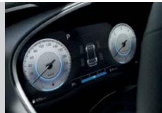
Màn hình thông tin digital 12.35 inch (Bản Đặc biệt và Cao cấp)