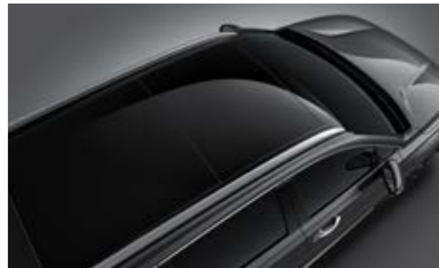
Cửa sổ trời toàn cảnh Panorama cùng thanh treo giá nóc (Bản Đặc biệt và Cao cấp)